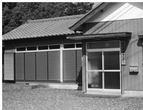
築36年の宮前集落センター

ル活動を行っているのか。町内の私立幼稚園では、どのようにプール活動を行っているのか。 答 国のガイドラインとは、指導と監視の職員を分けて配置し、その役割分担を明確にすること。職員の事前教育の徹底。緊急時の対応を整理・共有し、実践のための訓練の実施などの3点です。町の保育園では、この3点を徹底し、プール活動を実施し、私立幼稚園でも同様の安全管理が実施されています。