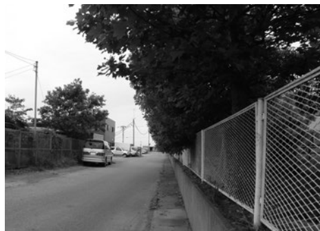
道路にはみ出した木々

答 生徒の安全安心、交通への支障、近隣の皆様へのご迷惑が生じないように対応したいと考えます。