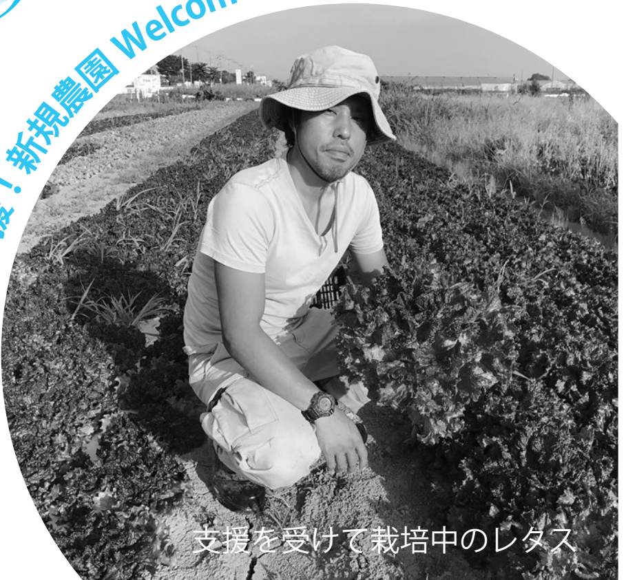
支援を受けて栽培中のレタス

川島町では、新たに農業を始めようとする方、または観光農園を開設しようとする方が、自立した農業経営が出来るよう補助金を交付して支援をしています。 今回の補正予算では、新規就農者の増加に伴い事業費が追加されました。