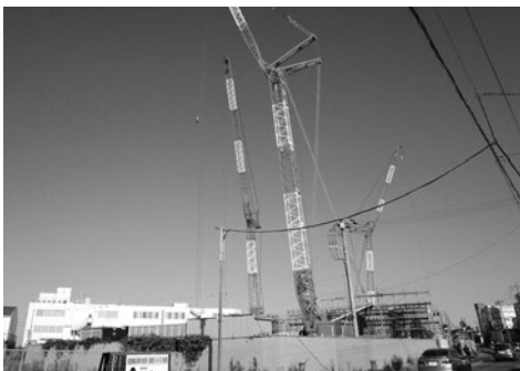
着々と進む工場建設

答 町道3545号の町道認定を廃止し、応急的措置ですが東松山警察署と協議し、早期に駐待機場として利用が開始できるよう、工業会と調整しています。