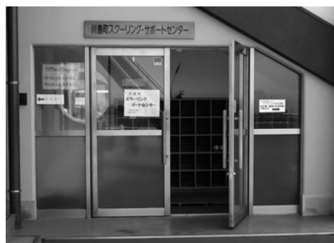
スクーリング・サポートセンター（かわみんハウス2階）

答 社協は62名、その内地域包括支援センターは4名です。総合相談（ワンストップ相談）の窓口が新たに保健センターに設置されます。