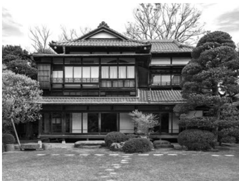
文化観光拠点としての遠山記念館

問 町のICT教育の状況は。 答 平成21年度小・中学校の全ての教室に電子黒板を設置。その後、平成28年度中山小学校、29年度に伊草小学校をICT活用研究校に指定し、それぞれにタブレット端末を15台、LAN回線8教室分導入し、効果的な活用方法を研究して参りました。今後、つばさ南・北小学校や中学校へのタブレット端末等の導入を検討して参ります。