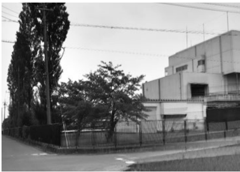
新規建設予定地は現吉見町ごみ処理場の隣に