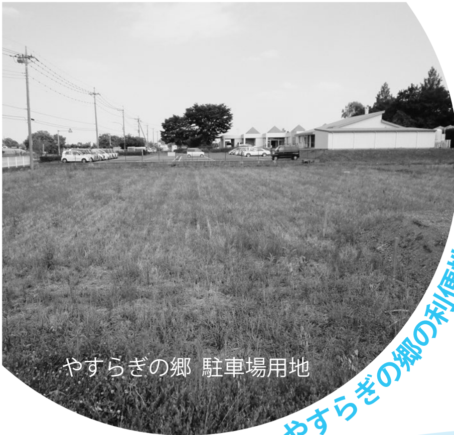
やすらぎの郷 駐車場用地