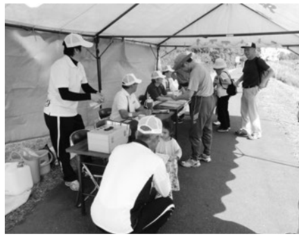
地域の核として活動する公民館